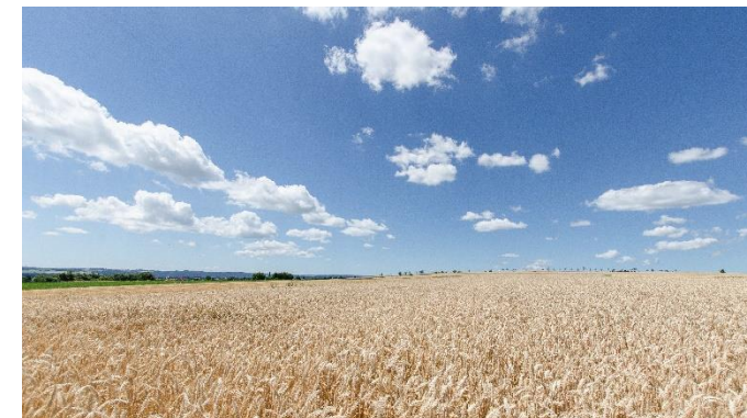
Weizenfeld bei Döggingen

Die Bildungsveranstaltungen werden im Auftrag des Bildungs- und Sozialwerks des LandFrauenverbandes Südbaden e. V. durchgeführt.